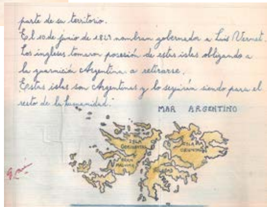
Escribir cien veces: son nuestras. Muestra temporaria curada por el Museo de las Escuelas y el Museo Malvinas e Islas del Atlántico Sur.