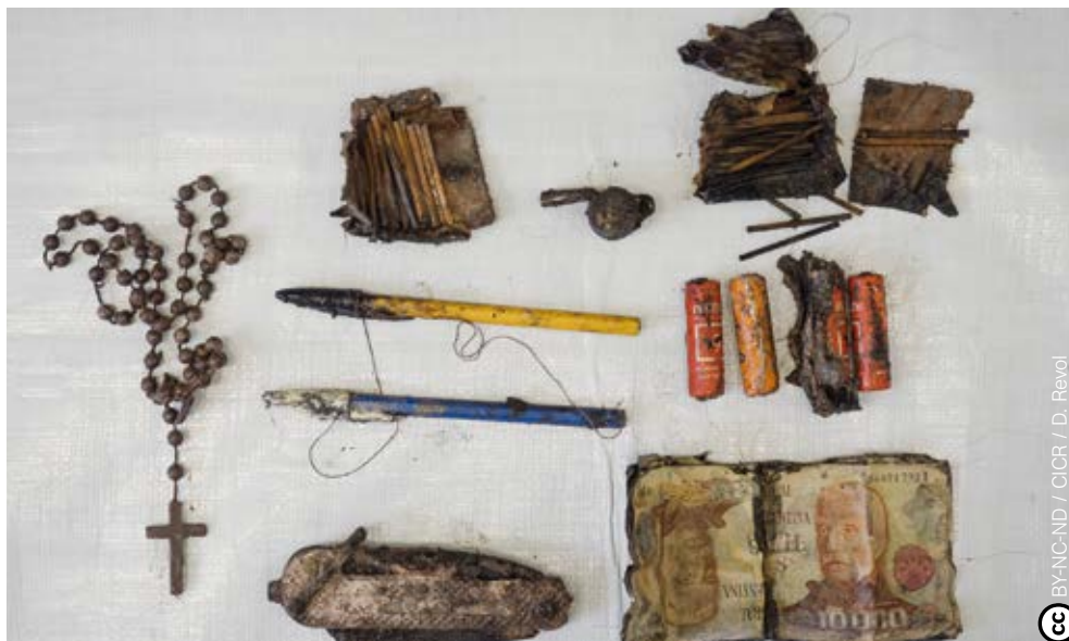
Objetos personales de soldados sepultados en el cementerio de Darwin hallados en 2017.