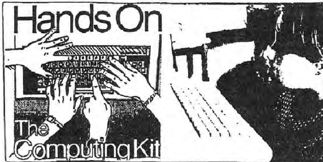
Figura 3: Curriculum contrahegemónico, un ejemplo concreto. Fuente: Hands On, The Computing Kit. Sydney, ClusterProductions, 1988.

(por ej. "la familia", "conductas desviadas"), y reorganizamos el curriculum de forma que diera prioridad a las perspectivas de las mujeres y de los homosexuales. Naturalmente, esto supuso nuevos materiales, pero no se apartó del terreno de la disciplina tradicional; más bien exigió ese conocimiento e intentó organizarlo. Un ejemplo de la práctica escolar es el material Hands On para el aprendizaje de la informática, elaborado por un grupo de escuelas para personas desfavorecidas y un centro de recursos regional de Sidney (ver Fig. 3). Supone una aproximación al aprendizaje de la informática que hace hincapié no sólo en las técnicas de manejo del "Toshiba", sino también en las repercusiones sociales de los ordenadores en los lugares de trabajo.